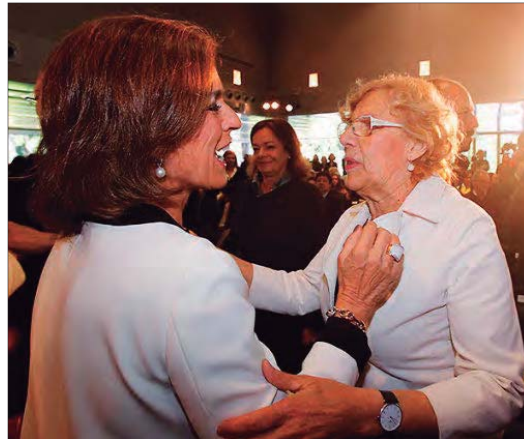
Ana Botella y Manuela Carmena en un acto en mayo.