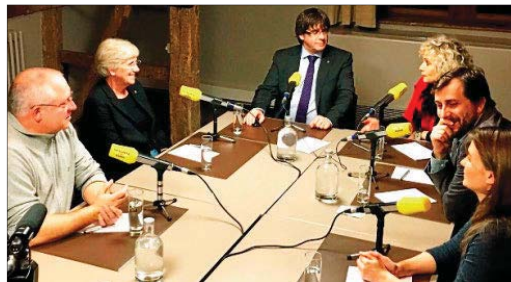
Puigdemont y sus ex «consellers» en la entrevista, ayer, con Catalunya Ràdio.