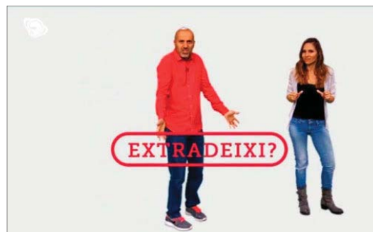
Los presentadores del programa infantil de TV3, durante sus explicaciones.

En el programa infantil también se precisa que «no todos los políticos del Govern están en prisión». «Los hay que se han ido a Bélgica, como el president Carles Puigdemont». «Consideran que en España el juicio no sería justo», ahonda la presentadora para volver a dibujar a la Justicia española como la responsable de encarcelar a los supuestos «presos políticos» catalanes.