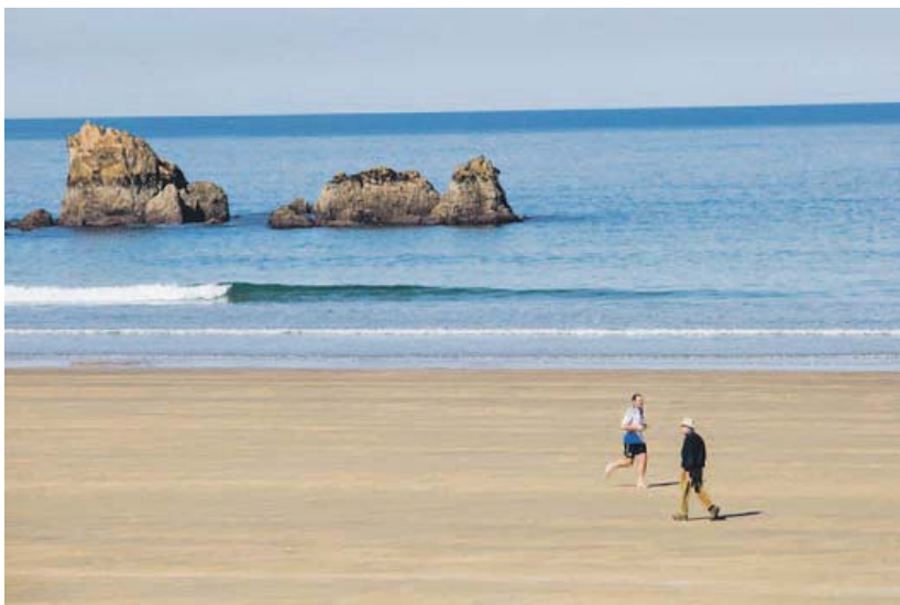
Playa de Aguilar, en Muros de Nalón, a primera hora de la tarde.