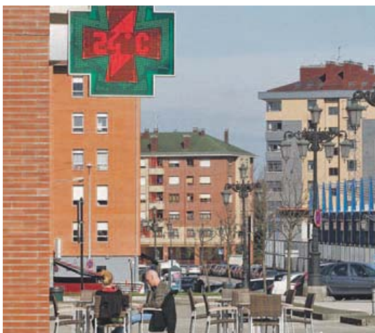
Termómetro de una farmacia en el barrio ovetense de La Corredoria ayer al mediodía.

los cielos estarán muy nubosos con precipitaciones.